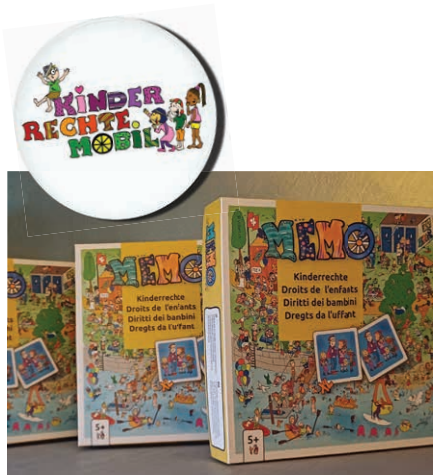
Kinderrechte Spiel mit Memo und Riesenwimmelbild

Die Kontaktaufnahmen erfolgen überwiegend telefonisch, vereinzelt auch per E-Mail. Wir hören zu, unterstehen der Schweigepflicht und triagieren Familien bei Bedarf an geeignete Fachstellen im Kanton Schwyz.